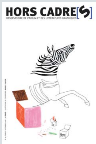
illustration : Audrey Calleja

La revue Hors Cadre[s] , publiée conjointement par l'atelier du poisson soluble, les éditions Quiquandquoi et l'Institut International Charles Perrault, propose des regards croisés de critiques et de créateurs sur la production contemporaine d'albums et, plus généralement, sur les supports associant textes et images.